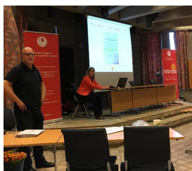
Victor Kristiansen (AP) presenterer alkoholpolitisk plan i Fredrikstad kommune (konferanse 5/9-17)

Se hjemmesiden vår: www.arbef.no for program og les mer om våre konferanser.